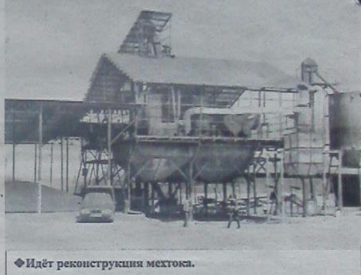
◆ Идёт реконструкция мехтока.

ского хозяйства и фирмой «Байер». Совместно с ними проводят опыты по применению комплексных подкормок: макро- и микроэлементов и биопрепаратов. В частности, применяли их на 70 гектарах сои. Эффект налицо: на опытных участках растения лучше развиваются и меньше болеют. Кусты высокие, с крупными листьями. Уже сейчас видно, что урожай будет процентов на 20 выше. С учётом того, что соя – культура дорогая и с высокой себестоимостью, это весомая прибавка. Аналогичные опыты